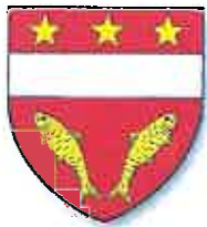
Syndicat Mixte pour le Sundgau