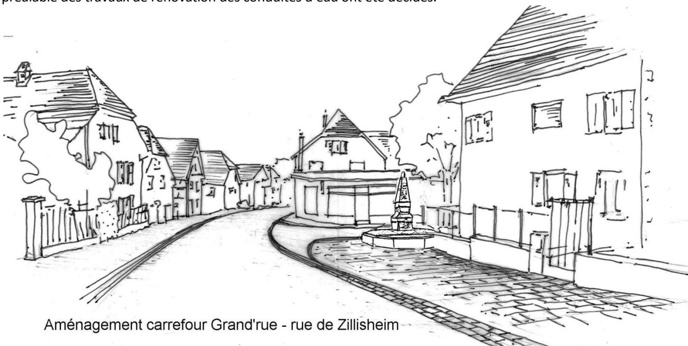
Aménagement carrefour Grand'rue - rue de Zillisheim

L'appel d'offres des travaux d'aménagement du carrefour rue de Zillisheim - Grand' Rue, 1 ère phase, des abords de la mairie a été favorable par rapport à l'estimation. Le chantier commencera début novembre. Au préalable des travaux de rénovation des conduites d'eau ont été décidés.